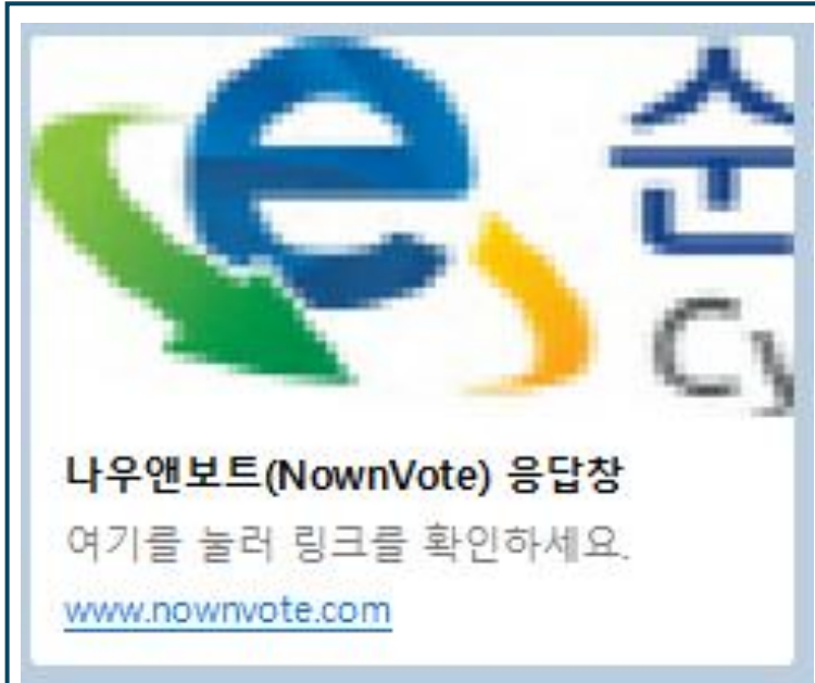
1. 나우앤보트 링크접속